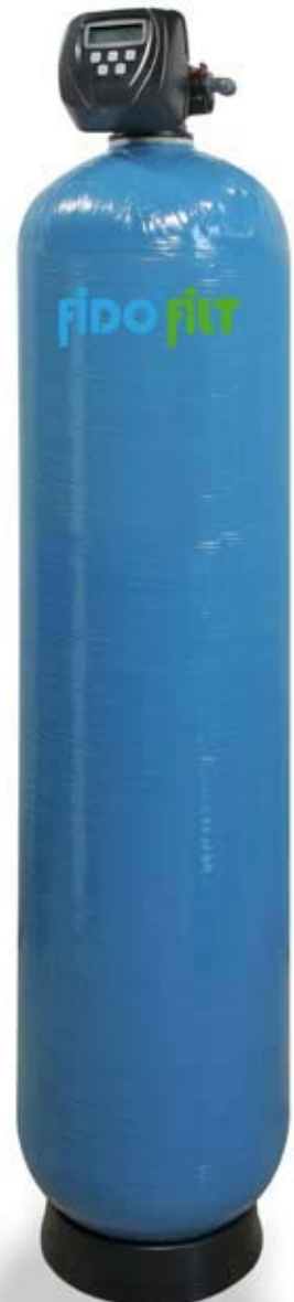
FMH WS1.25 Filteranlagen

Wasseraufbereitungssysteme für Eigenwasserversorger zur Entfernung von Eisen, Mangan und Schwefelwasserstoff aus Trink- und Brauchwasser.