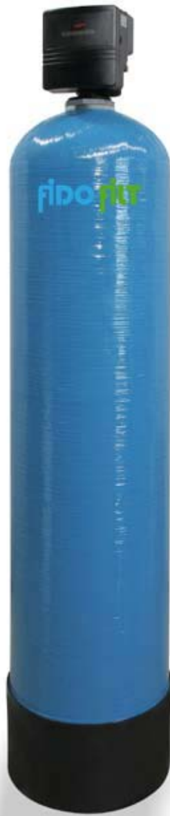
FMH 5000 Filteranlagen